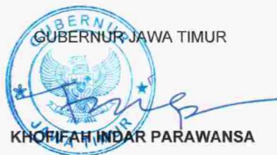
KHOFIFAH INDIRA PARAWANSA